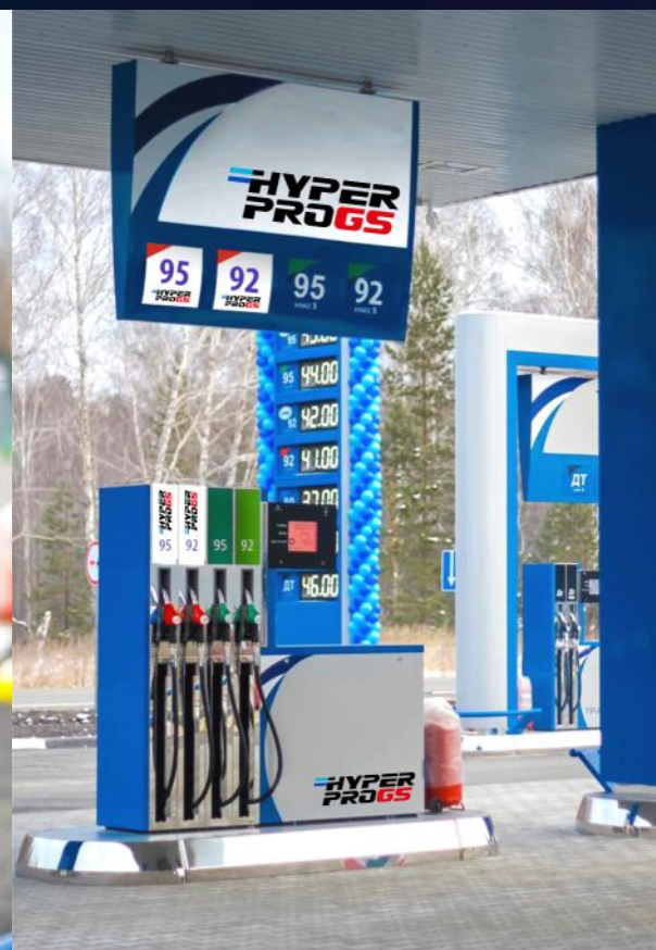
Вариант брендинга фасада